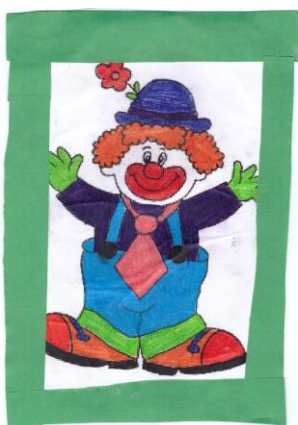
Kovács-Szalay Aisa 3.b