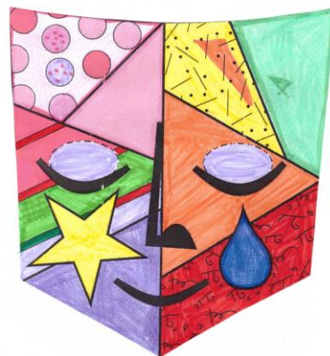
Pallagi Lilla 4.b