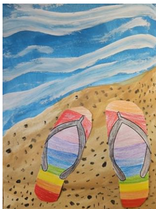
Taba Lorena 1.a